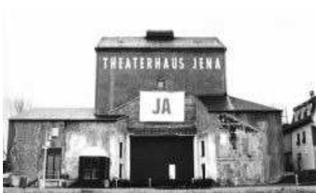
Ansicht des Theaterhauses Jena (vermutlich 1993)

Wieder ist es so weit: Die Kulturarena öffnet zum 20. Male ihre Tore. Wie in den Vorjahren bietet sie Kulturpassinhabern ein reiches Spektrum unterschiedlicher Kunstformen. Es besteht die Möglichkeit, 19 Konzerte und 14 Filmvorführungen zu genießen.