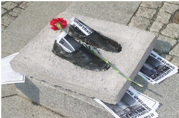
Prekäre Spurensuche (Beitrag auf Seite 12)

Im April 2011 trat das „Bildungs- und Teilhabepaket“ in Kraft. Danach können Eltern, die Hartz IV oder Wohngeld beziehen, Anträge stellen - auf Übernahme der Kosten für Schulausflüge Schülerbeförderung und Lernförderung und auf Zuschüsse für die Mittagverpflegung in Kitas und Schulen sowie Freizeitaktivitäten in den Bereichen Kultur und Sport. Wenn die Anträge bis zum 30.06.2011 vorliegen, werden die Leistungen rückwirkend zum 1. Januar 2011 gewährt.